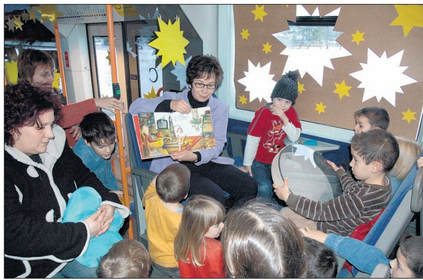
Wihnachts-Schtärne-Bahn: ein adventliches Erlebnis für Klein und Gross.

Die erste Fahrt ist um 15.54 Uhr ab Menziken, 9. Dezember, fährt die «Wihnachts-Schtärne-Bahn» durch unsere Gegend. Kinder (empfohlen ab vier Jahren) mit ihren Angehörigen werden im Zug adventlichen Geschichten lauschen. Die Reise wird musikalisch von Musikensembles aus der Region begleitet. Unser Sonderzug fährt bis nach Gränichen, wo die «Reisenden» einen feinen Punsch bekommen. Am Ende der Fahrt gibt es eine kleine Überraschung für den Heimweg.