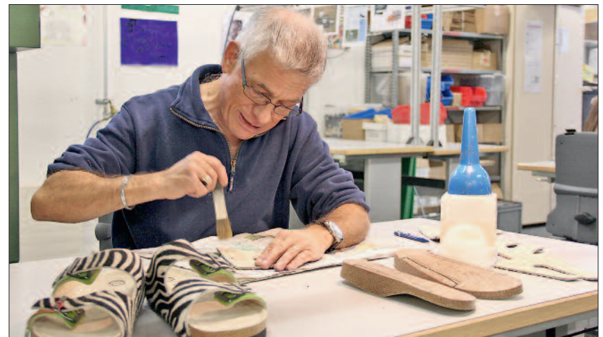
Bei jedem Produktionsschritt andere Fähigkeiten fördern – hier entsteht ein Paar Gesundheitsandalen für die Weihnachtsausstellung.