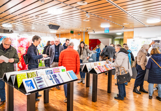
Mit der Türöffnung strömten die Leute in Scharen in den Saalbau, wo wieder viele kreative Produkte auf sie warteten.